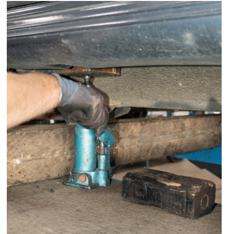
Sind alle Schrauben und Muttern gelöst, kann der Body endlich angehoben werden. Mit Hydraulik-Heber und Holzklötzen geht es nach oben.

» Vor rund einem Jahr haben wir unserem Redaktions-Jimny Reifen der Dimension 215/75 R15 verpasst. Mit der Original-Achsübersetzung funktioniert diese Reifengröße gerade noch so – zumindest beim Würfel mit Automatikgetriebe. An Steigungen oder beim Beschleunigen merkt man jedoch deutlich, dass der Wagen sich damit etwas quält.