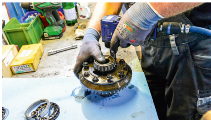
Der Druckluftschrauber erleichtert nicht nur die Demontage des Tellerrads. Immerhin sind hier zehn Schrauben zu lösen.