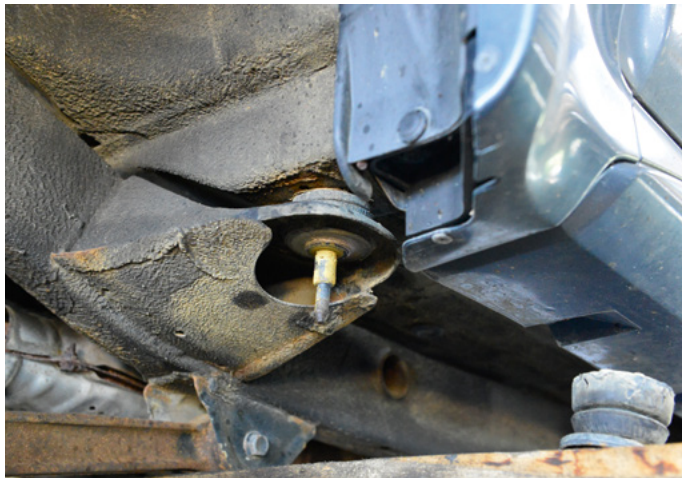
Anschließend kann die Karosserie vom Rahmen getrennt werden. Sie sind an mehreren Stellen fest miteinander verschraubt.