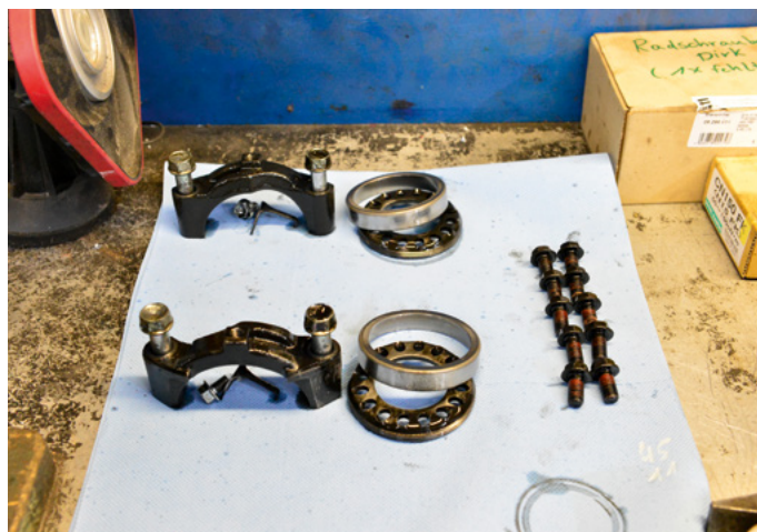
Für den späteren Zusammenbau werden alle demontierten Teile, die wieder eingebaut werden, fein säuberlich zur Seite gelegt.