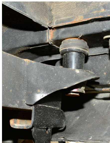
Rahmen und Karosserie sind nun durch Distanzstücke fünf Zentimeter weiter voneinander entfernt. Damit gibt es mehr Platz im Radhaus.