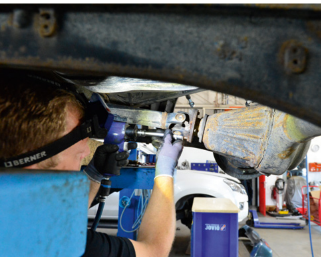
Nach dem Bodylift sind die Achsdifferentiale dran. Zunächst werden die Kardanwellen abgeschraubt.