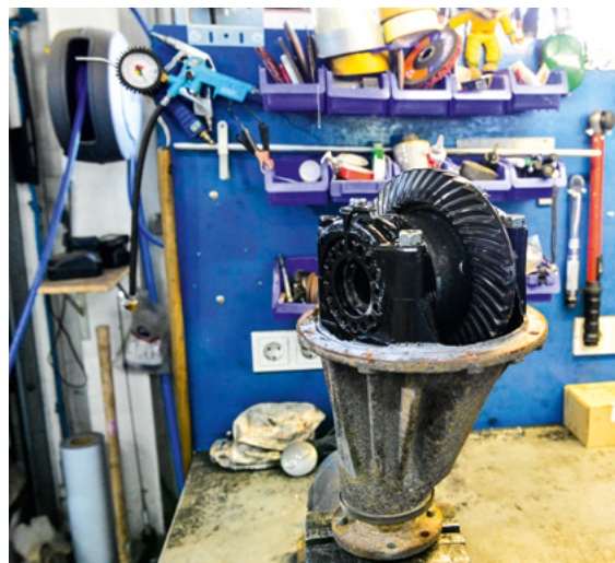
Beim Jimny wird für Arbeiten am Differential das gesamte Gehäuse demontiert. Danach lässt es sich in einen Schraubstock einspannen.