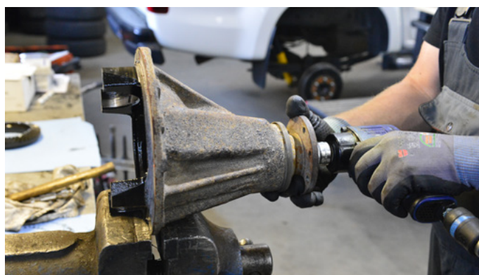
Anschließend wird die Welle, auf der das Kegelrad sitzt, gelöst. Sie ist auf der Seite der Kardanwelle verschraubt, muss aber ...