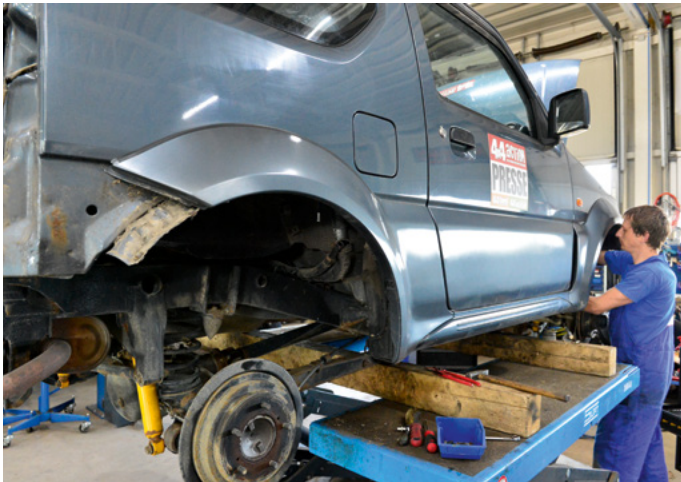
Um die Karosserie mit einem Bodylift um fünf Zentimeter anzuheben, müssen die Stoßstangen und ein paar andere Teile abmontiert werden.