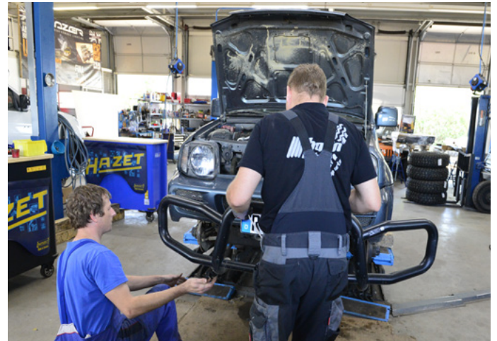
Auch unser Schutzbügel musste runter. Er wird später zusammen mit der Karosserie ein Stück nach oben wandern.